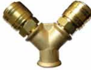
▶ AD38S2 3/8" İKİLİ STOPER SET