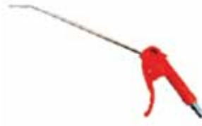
AKD - B30G 1/4" PT HAVA TABANCASI