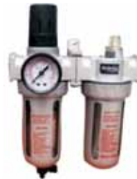
FRL 804 1/2" FRL İKİLİ ŞARTLANDIRICI