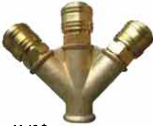
▶ AD38S3 - 3/8" ÜÇLÜ STOPER SET