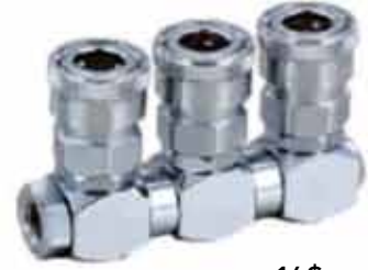
▶ AD-S31-3 ÜÇLÜ DÖNER STOPER