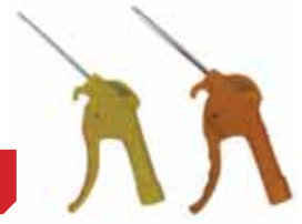
EB - 094 1/4" PT HAVA TABANCASI