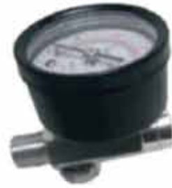
▶ AD-V512G 1/4" GÖSTERGELİ HAVA VALFİ