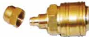
▶ AD08H 5*8 mm HORTUM UCU STOPER