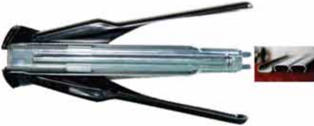
▶ AKDA-7C-RİNG PENSE