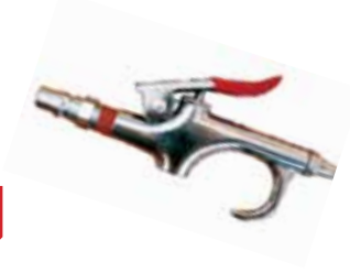
B08G 1/4" HAVA TABANCASI