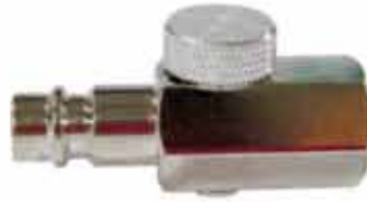
▶ AD-V52G 1/4" REKORLU HAVA VALFİ