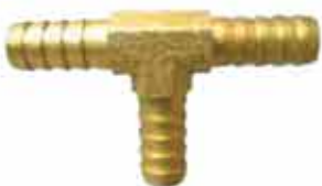
▶ AD3M8 - 8 mm T ÜÇLÜ REKOR