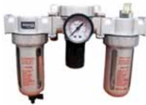
C - 804 1/2" FRL ÜÇLÜ ŞARTLANDIRICI