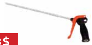
AKD B91GA HAVA TABANCASI