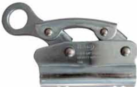
▶ AKD RG16 16mm HALAT TUTUCU

Halat Kalınlığı : 16 mm Halat Gözü : 20 mm Ağırlık : 440 gr. Paketleme : 50 adet