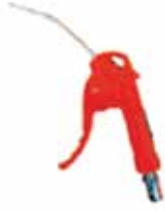
AKD - B12G 1/4" PT HAVA TABANCASI