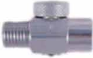
▶ AD-V502G 1/4" HAVA VALFİ