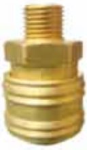
▶ AD14A 1/4" ERKEK STOPER