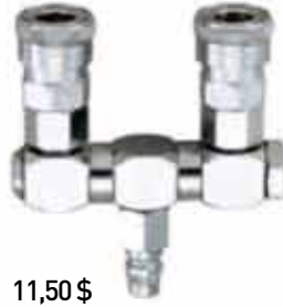
▶ AD-S31-2'2'Lİ DÖNER STOPER SET