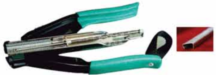
▶ AKD B-22 D-RİNG PENSE