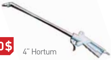
AKD - B40G MOTOR TEMİZLEME TAB.