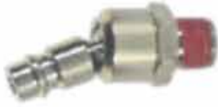
▶ AD-J702G - 1" HAREKETLİ REKOR