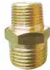
▶ AD03-04M - 3/8" - 1/2" NİPEL